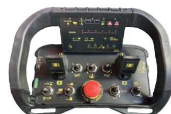
Radio console by AUTECH Console radio by AUTECH