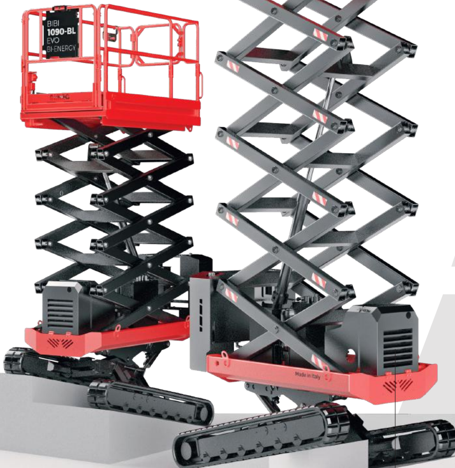
KUBOTA Diesel Z602